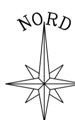
PLANIMETRIA Scala 1:10.000

SCALA GRAFICA 1:10.000 0m 100 200 300 400 500m